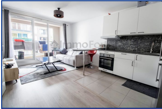
Coup de cœur

Référence VA10839, Mandat N°4263 Dans une résidence de l'année dernière.